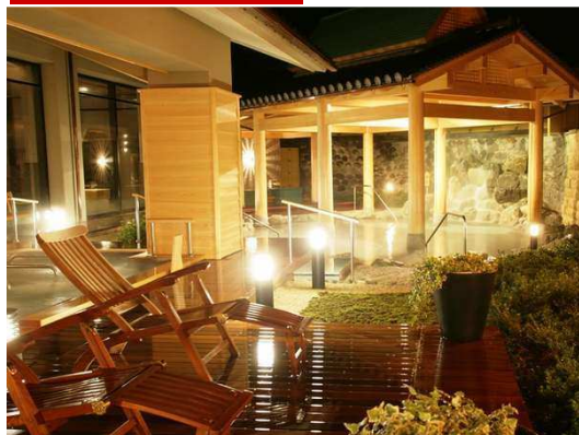
まつや千千 大浴場「万の湯」 ※イメージ

「あわら温泉の中でも北陸最大級スケール、源泉大浴場「千のこぼれ湯」を擁する旅館。できたて・つくりたての料理を、離座専用食事処「千代見草」にてお楽しみいただけます。日々のお疲れを忘れ、まつや千千でのひとときをごゆっくりお楽しみ下さい。