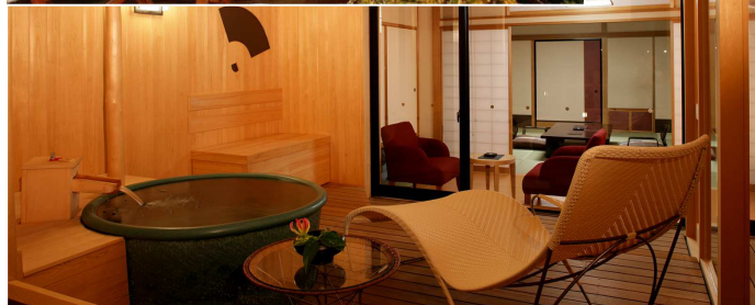
まつや千千/時忘れ離座 ※イメージ

【ご旅行代金】※1泊2食付/2名1室/日曜～金曜 大人宿泊代金 お一人様 35,200円 (サービス料込・税込)