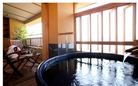
瑠璃光/星の棟Aタイプ ※イメージ