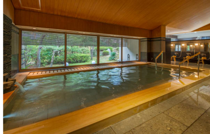
グランディア芳泉 /離れ専用大浴場 ※イメージ

【ご旅行代金】※1泊2食付/2名1室/日曜～金曜 大人宿泊代金 お一人様 33,000円 (サービス料込・税込)