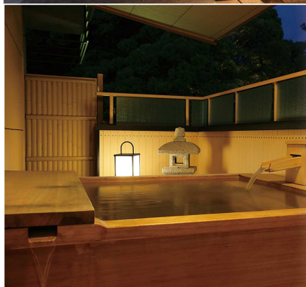
たちばな四季亭/露付き客室 ※イメージ