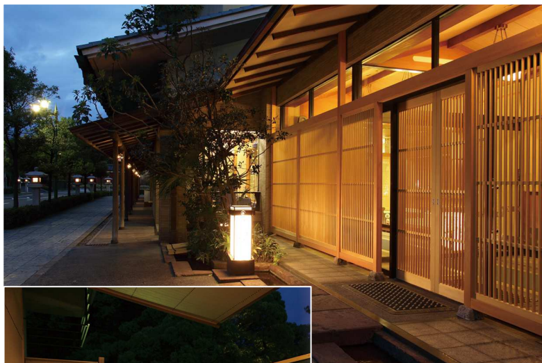
たちばな四季亭/外観